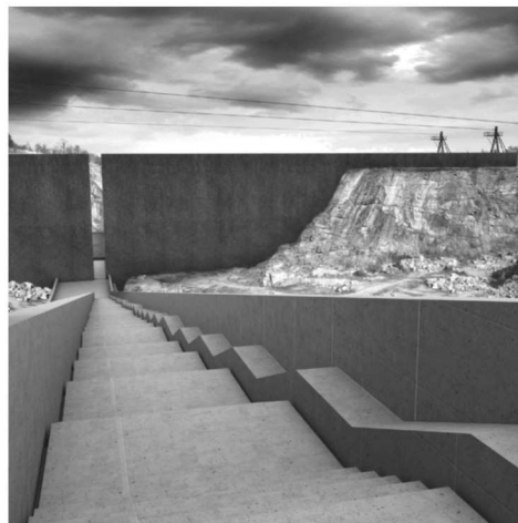
Monumentalne betonowe schody i metalowa skodorowana ściana