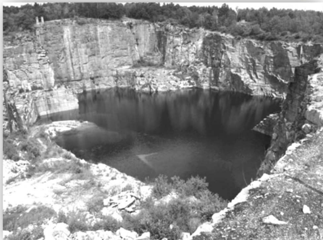
Kamieniołom - miejsce realizacji projektu (widok współczesny)